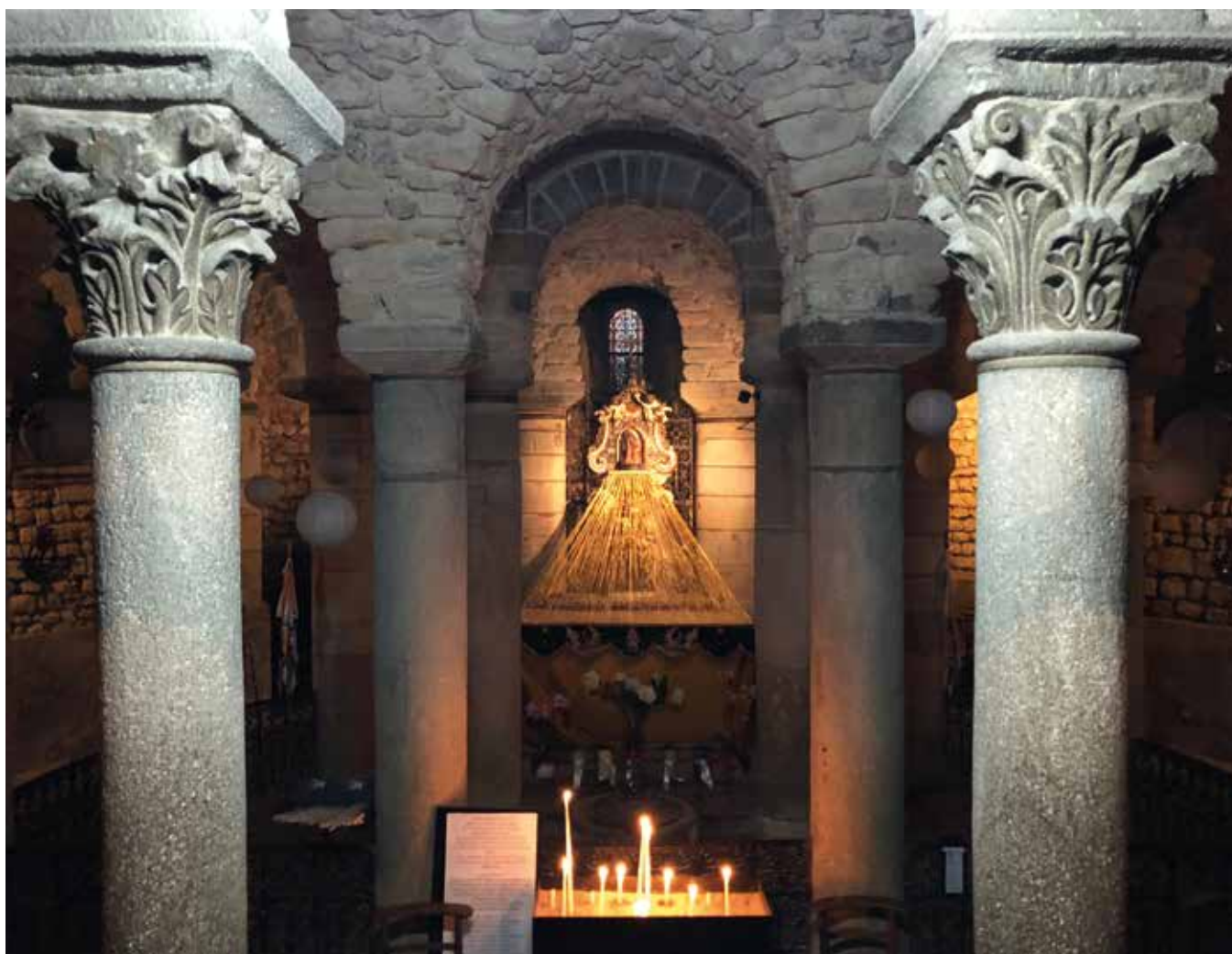
Crypte de la basilique Notre-Dame-du-Port