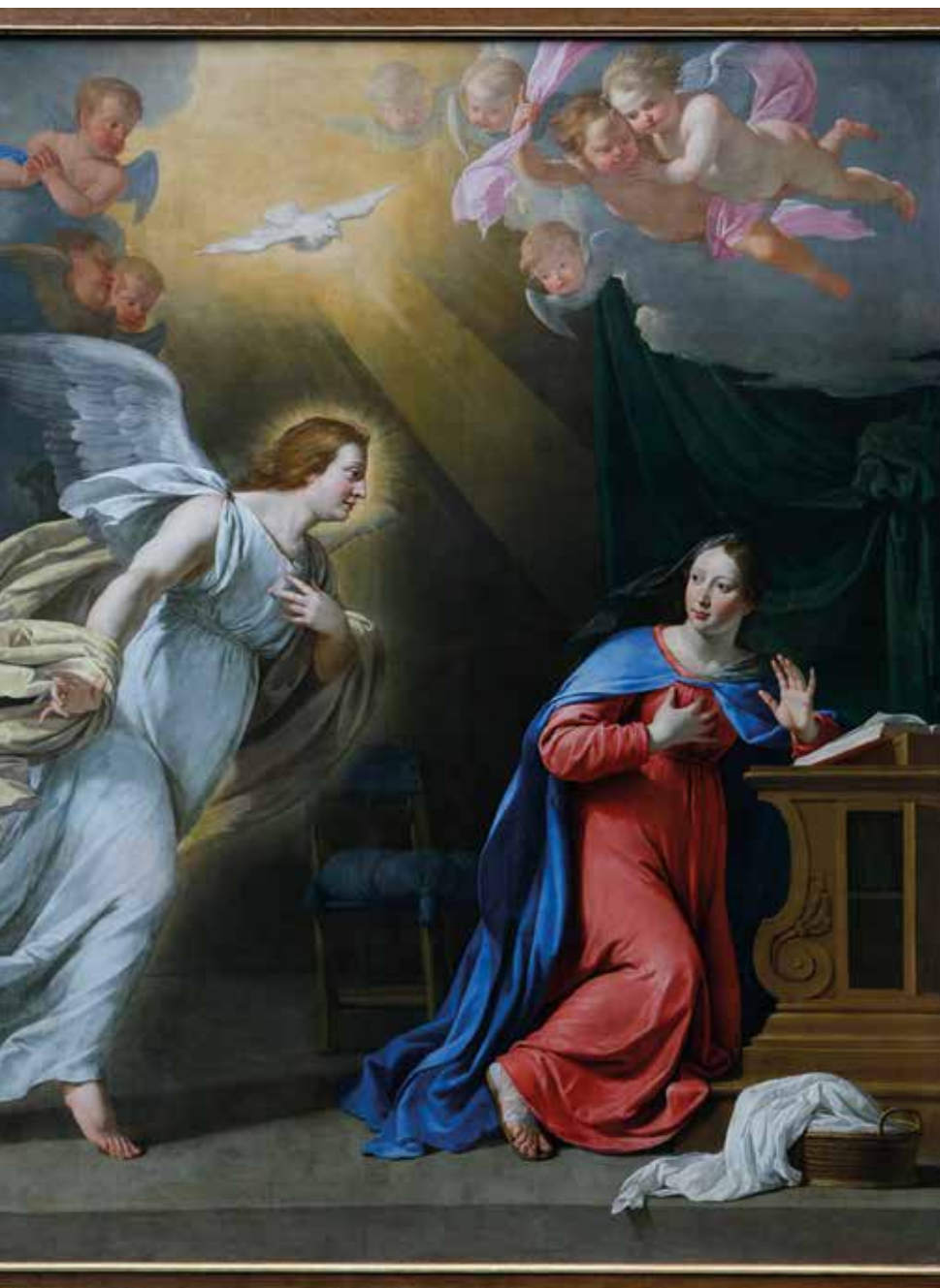
Philippe de Champaigne, Annonciation, ca. 1643, transept de la basilique Notre-Dame-du-Port © Ville de Clermont-Ferrand

À la Révolution, Notre-Dame-du-Port échappe de peu à la destruction complète, elle ne doit sa sauvegarde qu'à l'action des habitants du quartier qui la rachètent. Elle est rendue au culte, en 1802, et restaurée dans la première moitié du XIX e siècle. Parallèlement la dévotion à la Vierge noire de la crypte connaît un nouvel élan, soutenu par la volonté de l'Église d'affirmer la suprématie catholique sur la France. Deux événements concourent à faire de Notre-Dame-du-Port un lieu de pèlerinage majeur. En 1875, la Vierge noire est couronnée lors de fêtes grandioses rassemblant habitants de la ville et du diocèse. En 1880, le pape Léon XIII la promeut basilique mineure et, l'année suivante, elle est affiliée à Notre-Dame-de-Latran, ce qui permet d'octroyer des indulgences identiques à celles de la basilique romaine. En écho à ces reconnaissances officielles, la piété des fidèles se traduit par les centaines d'ex voto en marbre blanc installés dans la crypte.