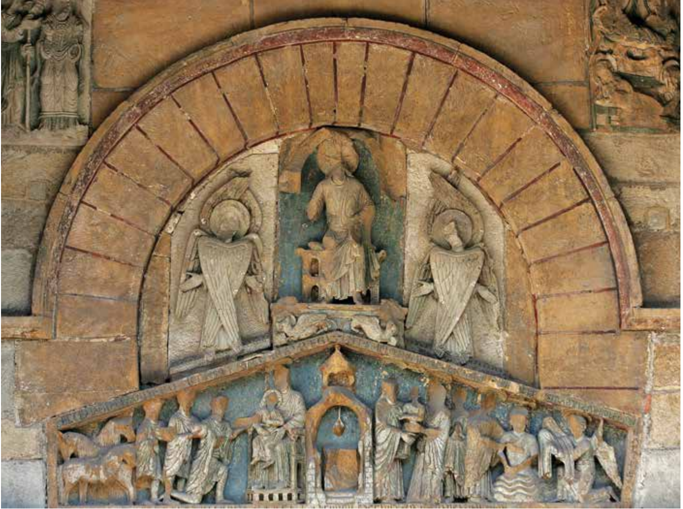
Portail sud de la basilique Notre-Dame-du-Port

contrebuter les poussées du clocher octogonal et des bas-côtés. Les toitures sont soutenues par des modillons à copeaux. Les ouvertures en plein-cintre sont soulignées d'un cordon de billettes. L'abside présente une mosaïque de pierres de laves de la région et de calcaire. La façade ouest s'ouvre sur un large portail en arc brisé, installé au XVI e siècle, encadré de deux tours en moellons. En 1924, Agnan Ratoïn construit un clocher en pierre de Volvic pour abriter cloches et carillon. Sur la façade sud sont visibles les départs d'arcs de chapelles édifiées au XV e siècle. De même, la porte gothique en pierre de Volvic, donnant dans la deuxième travée, ouvrait sur la chapelle Sainte-Marthe. Le portail sud est richement sculpté. Le linteau en bâtière (pentagonal) monolithe présente trois scènes distinctes : l'Adoration des Mages, la Présentation de Jésus au Temple et le Baptême du Christ. Au-dessus et au centre de l'arc de décharge, trône le Christ Pantocrator, encadré de l'alpha et de l'oméga. Le trône repose sur le symbole des évangélistes Luc (taureau) et Marc (lion), les deux autres bas-reliefs ont disparu. De part et d'autre de la scène centrale, se trouvent deux séraphins, les mains ouvertes. Au-dessus de l'arc de décharge, se devinent deux petits haut-reliefs, très endommagés, une Annonciation à gauche et une Nativité à droite.