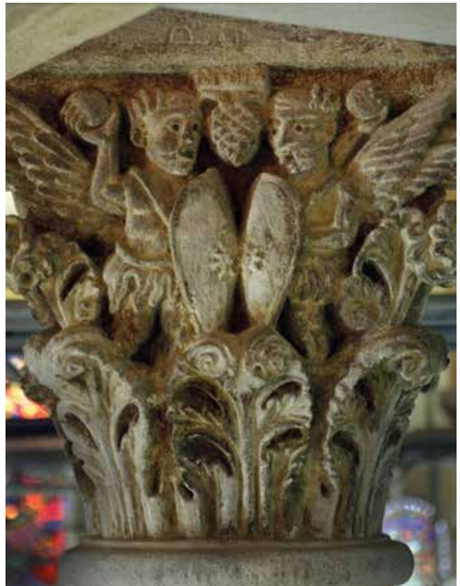
Chapiteau historié du déambulatoire de la basilique Notre-Dame-du-Port

contrebuter les poussées du clocher octogonal et des bas-côtés. Les toitures sont soutenues par des modillons à copeaux. Les ouvertures en plein-cintre sont soulignées d'un cordon de billettes. L'abside présente une mosaïque de pierres de laves de la région et de calcaire. La façade ouest s'ouvre sur un large portail en arc brisé, installé au XVI e siècle, encadré de deux tours en moellons. En 1924, Agnan Ratoïn construit un clocher en pierre de Volvic pour abriter cloches et carillon. Sur la façade sud sont visibles les départs d'arcs de chapelles édifiées au XV e siècle. De même, la porte gothique en pierre de Volvic, donnant dans la deuxième travée, ouvrait sur la chapelle Sainte-Marthe. Le portail sud est richement sculpté. Le linteau en bâtière (pentagonal) monolithe présente trois scènes distinctes : l'Adoration des Mages, la Présentation de Jésus au Temple et le Baptême du Christ. Au-dessus et au centre de l'arc de décharge, trône le Christ Pantocrator, encadré de l'alpha et de l'oméga. Le trône repose sur le symbole des évangélistes Luc (taureau) et Marc (lion), les deux autres bas-reliefs ont disparu. De part et d'autre de la scène centrale, se trouvent deux séraphins, les mains ouvertes. Au-dessus de l'arc de décharge, se devinent deux petits haut-reliefs, très endommagés, une Annonciation à gauche et une Nativité à droite.