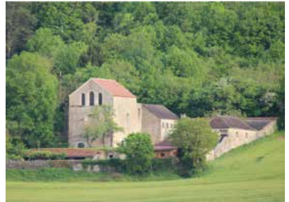
La Chapelle de la Cordelle Située sur le flanc Nord de la colline, premier ermitage franciscain de France