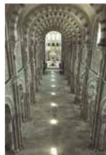
Chemin de lumière Le 21 juin, à midi solaire, le soleil projette ses rayons à travers les fenêtres hautes, formant au centre de la nef une succession de tâches lumineuses