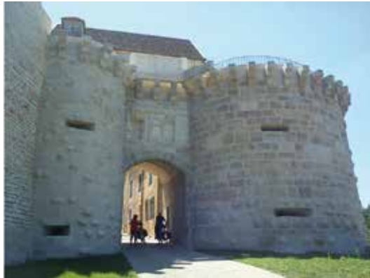
La Porte neuve Porte fortifiée du 16e située sur les remparts Nord