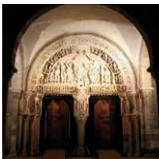
Le narthex Situé avant la nef, lieu de préparation au recueillement des pèlerins, au centre le grand tympan du Christ en gloire

Depuis 2005, on peut se rendre à pied à Assise en Italie, ville natale de saint-François, fondateur de l'ordre franciscain.