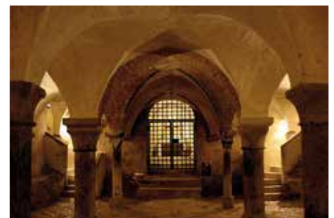
La crypte Située sous le chœur, conserve les reliques de Marie-Madeleine