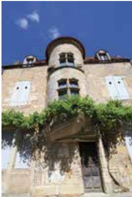
La Tourelle Gaillon Tour du 15e en encorbellement (rue St-Pierre)

A Vézelay, Moyen-Âge et modernité se côtoient. Les vieilles maisons étagées à flanc de colline sur de magnifiques caves voûtées qui, aux siècles passés, accueillirent les pèlerins, les ruelles serpentant à travers les jardins, le chemin de ronde et les anciennes portes... Tous ces charmes font de Vézelay un des plus beaux villages de France.